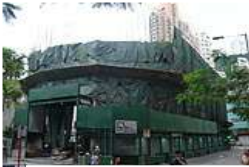
城市規劃委員會 Town Planning Board